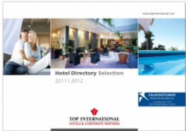
Zwei in eins: Der neue Katalog umfasst Top International und Falkensteiner

DÜSSELDORF. Zum Jahresbeginn stellt Top International Hotels & Corporate Partners die neuen Broschüren 2011/2012 vor. Zum ersten Mal wird der Hotel-Directory Selection dabei gemeinsam mit dem Marketingpartner Falkensteiner Hotels & Residences aufgelegt.